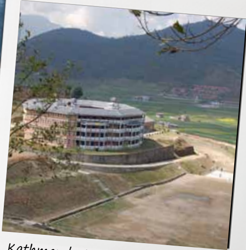
Kathmandu University er i dag et godt universitet med mange studier.