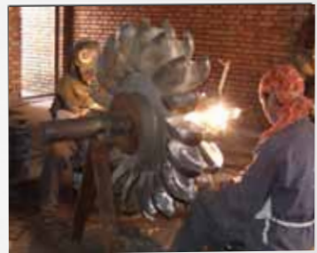
Sveising i turbinlabben

Dette var i desember 1970, og noen av de første fagarbeiderne var allerede i gang med egne små verksteder. Andre læregutter var i slutten av fire års læretid.